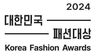
워드마크( TYPE A 혼합형 )