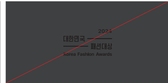
유사한 배경색 위에 사용하는 경우