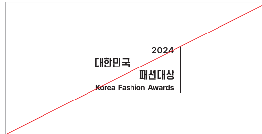
임의로 그래픽을 변형하여 사용하는 경우