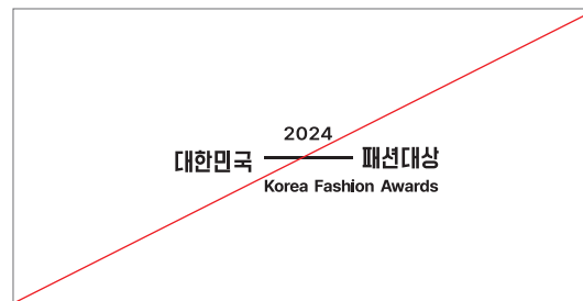
임의의 조합으로 사용하는 경우