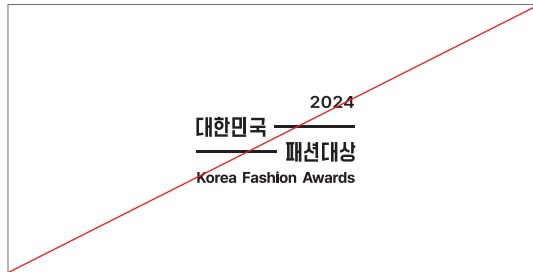
정비례가 아닌 임의 비율로 변경하는 경우

기관의 기본 요소인 로고 디자인의 형태를 임의로 바꿀 경우 본래의 이미지가 손상되므로 반드시 표준 형태를 사용해야 한다. 본 항의 예시는 색상을 잘못 사용한 경우나 임의로 형태를 변경한 경우, 다른 그래픽 요소들이 이미지를 손상시킨 경우이다. 이러한 적용은 시각적 인지도를 낮추고, 이미지의 혼란을 초래하므로 이와 비슷한 어떤 방법도 사용해서는 안되며 만일 사용 가능성에 대한 의문점이 발생할 경우에는 담당부서에 문의하여 본래의 이미지가 변형되지 않도록 한다.