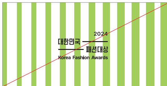
복잡한 이미지 위에 로고를 사용하는 경우