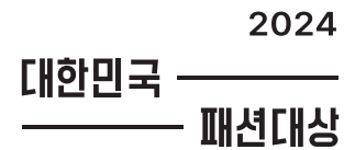
워드마크( TYPE A 국문형 )