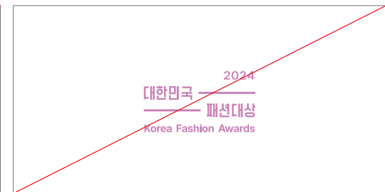
규정되어있지 않은 컬러를 임의로 사용하는 경우